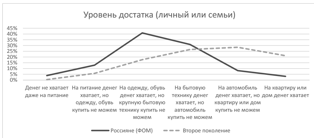
Рис. 2. Уровень достатка респондента или его семьи

новании Международного классификатора профессий ISCO-08 (табл. 2). Среди мигрантов второго поколения больше белых воротничков, а также руководителей (15–8% и 12–3% соответственно). В последнем случае, скорее всего, речь идет о собственном бизнесе. Россиян, напротив, больше среди синих воротничков – квалифицированных рабочих, занятых ручным трудом (6–13%) и использующих машины и механизмы (5–10%).