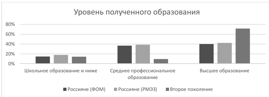
Рис. 3. Уровень полученного образования (24–30 лет), Хи-квадрат = 124,777***